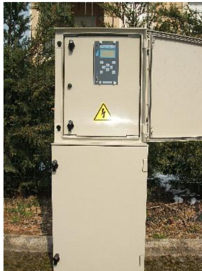
ACMIX version EDF